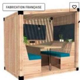
french cabine 4 places - Cabine intérieure et extérieure en bois pour 4 personnes