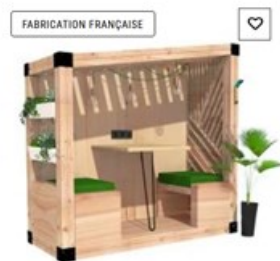
french cabine 2 places T1 - Cabine intérieure et extérieure en bois pour 2 personnes

La CFE-CGC a demandé un retour des tisaneries avec machines à café, tables mange-debout et fontaine à eau froide et chaude sans bouteille. Nous avons également demandé un espace de restauration libre avec réfrigérateurs et micro-ondes